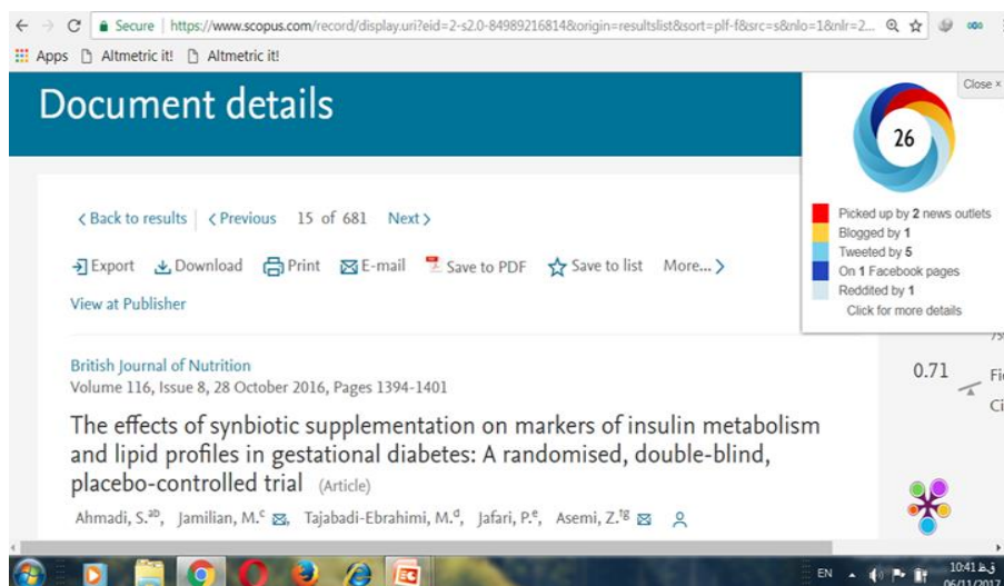
شکل (۱) نمونه نشان دادن نمره دگرسنجه مقاله در پایگاه اسکوپوس