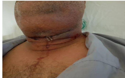
شکل ۱) نمای اولیه گردن بیمار، در هنگام مراجعه به بیمارستان خلیلی شیراز

گردنی گسترش یافته بود. در معاینه دهانی هیچ بیماری دندان‌آشکاری مشهود نبود. محل انسزیون و درن ناشی از جراحی قبلی بدون شواهد خروج چرک مشهود بود. فلپ پوستی ضمن تورم سفت غیر گوده‌گذار به رنگ تیره، تغییر رنگ داده بود. (شکل ۱)