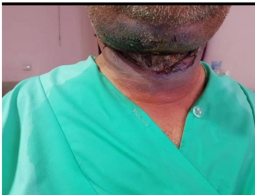
شکل ۳) پیشرفت شدید ادم گردنی و تغییر رنگ فلپ پوستی به صورت نکروز

لذا با تشخیص قبلی، آنتی‌بوتیک پنی‌سیلین و مترونیدازول شروع و بیمار به بخش گوش و حلق و بینی منتقل شد. پس از ۲۴ ساعت با توجه به پیشرفت شدید ادم گردنی و تغییر رنگ فلپ پوستی به صورت نکروز بیمار به اتاق عمل منتقل شد. (شکل ۳) و تحت دبریدمان بافت‌های نکروتیک قرار گرفت.