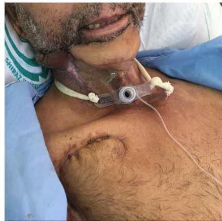
شکل ۶) پیگیری پس از سه ماه از ترمیم