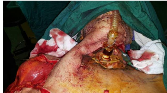
شکل ۵) پس از بازسازی با فلپ دلتوپکتورال

مرخص و در پیگیری یک و سه ماهه ضمن بازسازی موفق با فلپ هیچ آثاری از نکروز مشهود نبود. (شکل ۶)