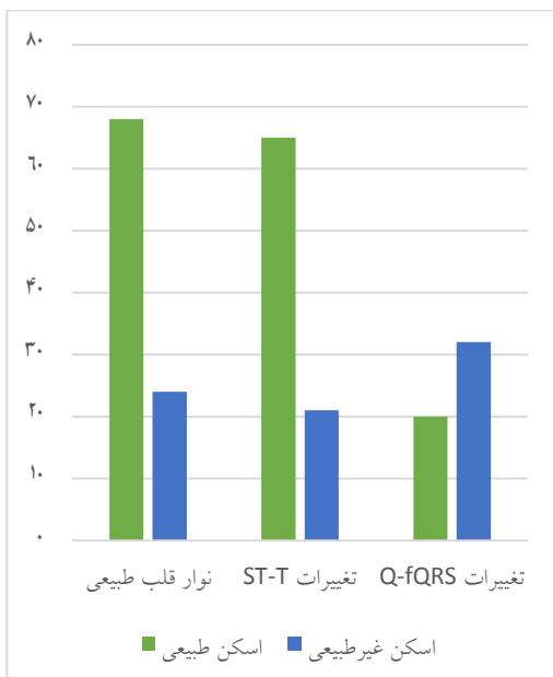
نمودار ۱) توزیع اسکن پرفیوژن میوکارد طبیعی و غیر طبیعی در سه زیر گروه نوار قلب

مقایسه زیر گروه‌های مورد بررسی با استفاده از آزمون کای دو بر اساس یافته‌های ECG بر حسب متغیرهای دموگرافیک و بالینی بیماران نشان داد که اگر چه سه زیر گروه مورد بررسی از لحاظ متغیرهای سن ( P=0/398 )، دیابت ( P=0/696 )، پرفشاری خون ( P=0/199 )، اختلالات چربی خون ( P=0/130 )، استعمال سیگار ( P=0/534 ) و سابقه فامیلی مثبت CAD ( P=0/686 ) که جزء فاکتورهای خطر ابتلا به CAD می‌باشند، تفاوت معناداری نداشتند اما از نظر شیوع سابقه CAD تفاوت معناداری مشاهده شد ( P<0/001 ).