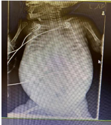
شکل (۱) گرافی بیمار با شواهد وجود کبد و طحال بزرگ

بیمار به مدت سه روز در بیمارستانی در یکی از شهرستان بوشهر با تشخیص اولیه تب و پان سیتوپنی بستری بوده ولی به علت نیاز به تشخیص و درمان قطعی به مرکز ما اعزام شد. بعد از اقدامات اولیه احیا و شروع آنتی‌بیوتیک‌های ترکیبی و قوی‌ال‌اثر (سفتریاکسون با دوز ۱۰۰ میلی‌گرم به ازای هر کیلوگرم وزن بدن و وانکومايسين با دوز ۸۰ میلی‌گرم به ازای هر کیلوگرم روزانه) و به علت شوک سپتیک و هیپوکسمی شدید پس از اینتوباسیون زیر دستگاه ونتیلاتور قرار داده شد، بیمار متأسفانه و علیرغم تلاش‌های فراوان، صبح روز بعد از پذیرش به علت عفونت شدید فوت نمود. لازم به ذکر است که والدین منسوب درجه یک (دخترخاله و پسرخاله) بودند. در معاینه فیزیکی نکته مهم اندازه قد و وزن نرمال بیمار و آزمایشات مأخوذ به شرح زیر بود: شمارش گلبول سفید ۲۵۰۰ (با ۷۰ درصد نوتروفیل)، شمارش گلبول قرمز ۲/۰۰۰/۰۰۰، هموگلوبین ۵/۵ گرم در دسی‌لیتر، پلاکت ۳۰/۰۰۰ در لام پریفرال،