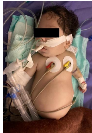
شکل ۲) ظاهر رنگ پریده و اتساع شکمی شیرخوار

مورد در منابع علمی نیز اخذ گردید. نهایتاً برای این بیمار، بیماری ذخیره چربی از نوع Lipid storage disease بیماری Niemen-pick مطرح شد (شکل - ۲).