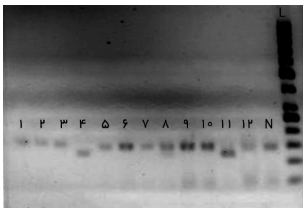
شکل ۲) الکتروفورز محصول حاصل از هضم آنزیمی بر روی ژل آگاروز ۲ درصد نمونه‌های شماره ۴ و ۱۱ هموزیگوت‌های A/A و سایر باندها هموزیگوت‌های G/G می‌باشند. L نشانگر استاندارد وزن مولکولی DNA است. باند پایین ژل پرایمردایمر می‌باشد.

فراوانی هموزیگوسیتی برای آلل A (ژنوتیپ A/A) در بین افراد دیابتی و غیردیابتی به ترتیب برابر با صفر و ۳ نفر، فراوانی هموزیگوسیتی برای آلل G (ژنوتیپ G/G) در بین بیماران و افراد سالم نیز به ترتیب برابر با ۷ و ۱۱ نفر بود. در این مطالعه مشاهده شد که فراوانی هتروزیگوسیتی (ژنوتیپ A/G) در بین افراد دیابتی و غیردیابتی به ترتیب برابر با ۹۵ و ۸۶ نفر است. فراوانی آلل A در گروه بیماران ۷ و در گروه کنترل ۱۷ بود. فراوانی آلل G در گروه بیماران ۱۹۷ و در گروه کنترل ۱۸۳ بود. در این مطالعه براساس مطالعات هوریکایا و (۳۹) و گارانت (۳۱) که در دو جمعیت آمریکایی‌های مکزیک‌تبار و آمریکایی‌های آفریقایی‌تبار انجام شد، داشتن آلل G را عامل خطر (Risk factor) محسوب کرده‌ایم و در این مطالعه مشاهده گردید که بین توزیع آلل‌های A و G در گروه بیماران و کنترل تفاوت معنادار آماری مشاهده شد ( P=0/037 ; 6/45 و 1/06 ) (۹۵ درصد CI و OR=2/61 ).