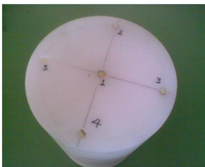
شکل ۱) فانتوم استفاده شده در این تحقیق

بررسی میزان شاخص دُز برش‌نگاری رایانه‌ای (CTDI) و توزیع دُز برای اندام‌ها در سی تی اسکن سر و قفسه صدی، در مرکز سی تی اسکن بیمارستان رازی شهر رشت وابسته به دانشگاه علوم پزشکی گیلان در بهار و تابستان سال ۱۳۹۰ صورت گرفت. به‌منظور برآورد دُز دریافتی توسط بافت‌ها از دو فانتوم سر و تنه با ابعاد استاندارد استفاده شد که در آن یک حفره مرکزی و چهار حفره پیرامونی به قطر ۱ سانتی‌متر جهت جاگذاری تراشه‌های دُزیمترهای گرماتاب (TLD) ۱ تعبیه شده است (شکل ۱).