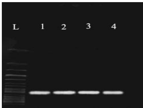
شکل ۱) ژل الکتروفورز قطعه ۵۲۴bp حاصل از ژن card

توالی تکثیر شده این قطعه در نمونه‌های مختلف، یکسان بوده و الگوهای یکسانی را نشان می‌دهد. این یافته‌ها در شکل ۱ نشان داده شده است. این مسئله صحت طراحی منطقه انتخاب شده و نیز محاسبه صحیح برنامه PCR را اثبات نمود.