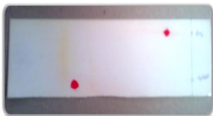
شکل ۲) بررسی حضور هیستیدین در عصاره گیاهی با استفاده از معرف نانهیدرین (لکه‌ی استاندارد هیستیدین و نمونه عصاره بر روی صفحه کروماتوگرام مشاهده می‌شود).

روی صفحه کروماتوگرام مشاهده شد. با مقایسه فاکتور بازداری (Rf) هیستیدین ( Rf_{His} = 0/22 ) با نمونه، عدم وجود هیستیدین تأیید شد (شکل ۲).