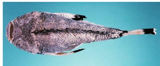
تصویر ۱) سنگ ماهی Pseudosynanceia melanostigma موسوم به فریاله، در سواحل بوشهر

گونه‌ی شایع سنگ ماهی در سواحل خلیج فارس Pseudosynanceia melanostigma است که در نزد بومیان منطقه ایرانی خلیج فارس به فریاله ماهی موسوم است. این ماهی در سواحل گلی استان بوشهر و حوالی خور موسی به فراوانی دیده می‌شود و زهرآفرینی آن، برای تمامی سواحل‌نشینان بومی شناخته شده است. تصویر ۱ مربوط به سنگ ماهی Pseudosynanceia melanostigma موسوم به فریاله می‌باشد که در سواحل بوشهر گرفته شده است.