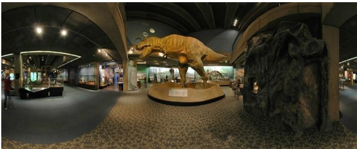
تصویر ۸) موزه علم بوستون (سالن طبیعت‌شناسی) (۱۳۹۳)

هر کدام از موزه‌های علم در سراسر دنیا، بخش‌ها و یا برنامه‌های منحصر به فرد مخصوص به خود را دارند. یکی از این برنامه‌های جالب، برنامه‌ی سپری کردن شب در موزه برای دانش‌آموزان است که آن‌ها می‌توانند یک شبانه روز در موزه بمانند و با قسمت‌های مختلف آن به خوبی آشنا شوند. یا مثلاً موزه‌ی شیکاگو به علت برگزاری گالری‌های بسیار زیادی که به صورت موقت ارائه می‌کند شهرت دارد (۱۳).