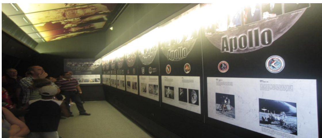
تصویر ۱۹) موزه ملی هوا فضا واشنگتن DC (۱۳۹۰)

در این قسمت لیستی از ۱۰ موزه‌ی علم و فناوری برتر دنیا ذکر شده‌اند (جدول ۲) که شامل: