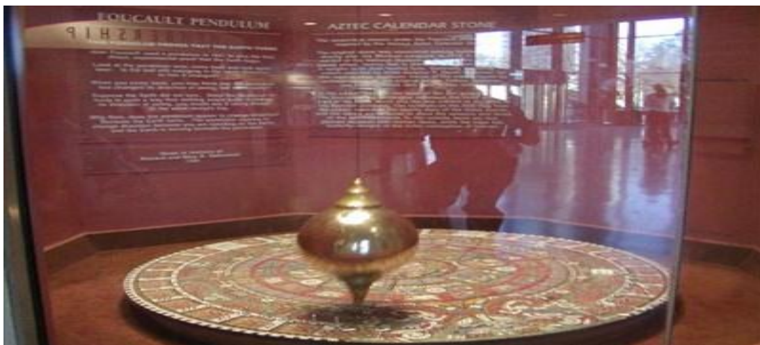
تصویر ۵) پاندول کیهانی (۱۳۹۳)