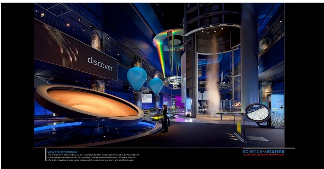
تصویر ۱۳) گالری هجوم علم موزه علم و صنعت شیکاگو

( http://dn.educationaltravel.com/sites/museum-of-science-and-industry-2/ )