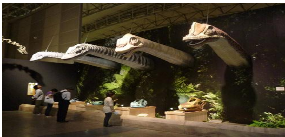
تصویر ۴) موزه علم بوستون (بخش طبیعت‌شناسی)

http://dinotobyblog.com/forum/index.php?topic=865.0