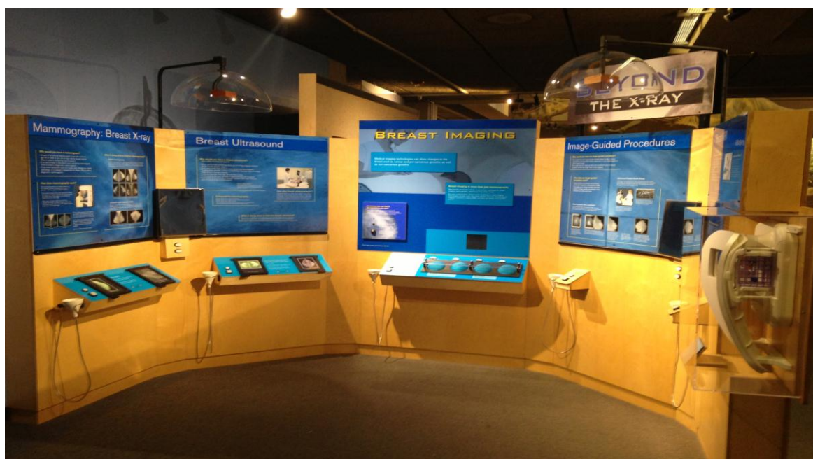
تصویر ۱۱) سالن آشنایی با تصویربرداری پزشکی (۱۳۹۳)