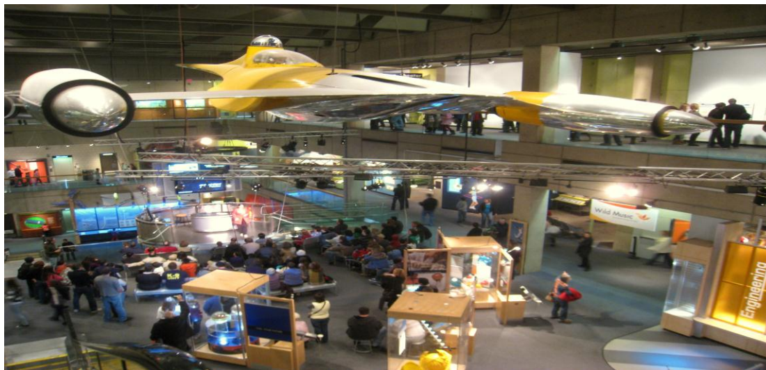
تصویر ۳) نمای داخلی موزه علم بوستون (۱۳۹۳)

مدل سازی از مزوزوئیک، ماشین‌ها و حمل و نقل، به سمت ماه، زندگی روی لبه‌ی پرتگاه، کامپیوتر.