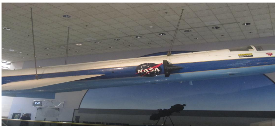
تصویر ۲۱) موزه ملی هوا فضا واشنگتن DC (۱۳۹۰)