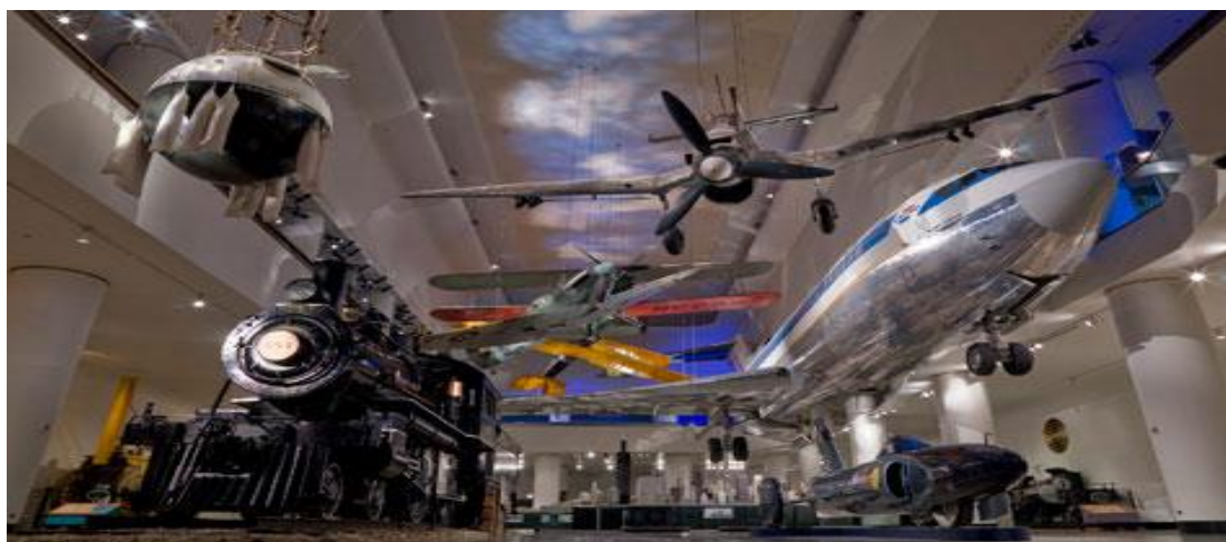
تصویر ۲۰) موزه ملی هوا فضا واشنگتن DC (۱۳۹۰)