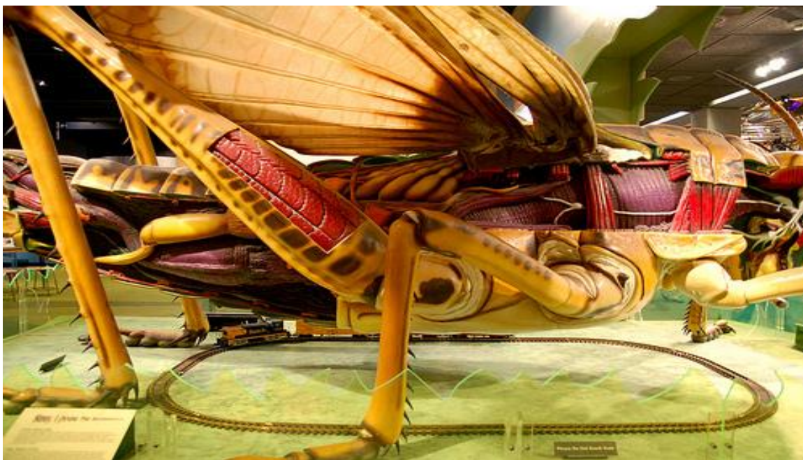
تصویر ۱۰) سالن زیست پزشکی (۱۳۹۳)