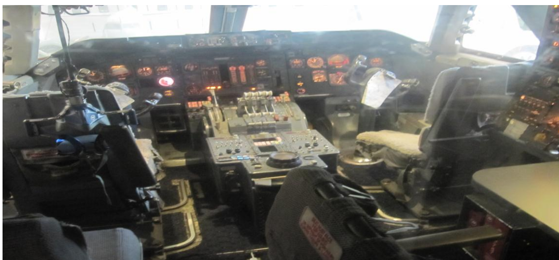
تصویر ۲۲) موزه ملی هوا فضا واشنگتن DC (۱۳۹۰)