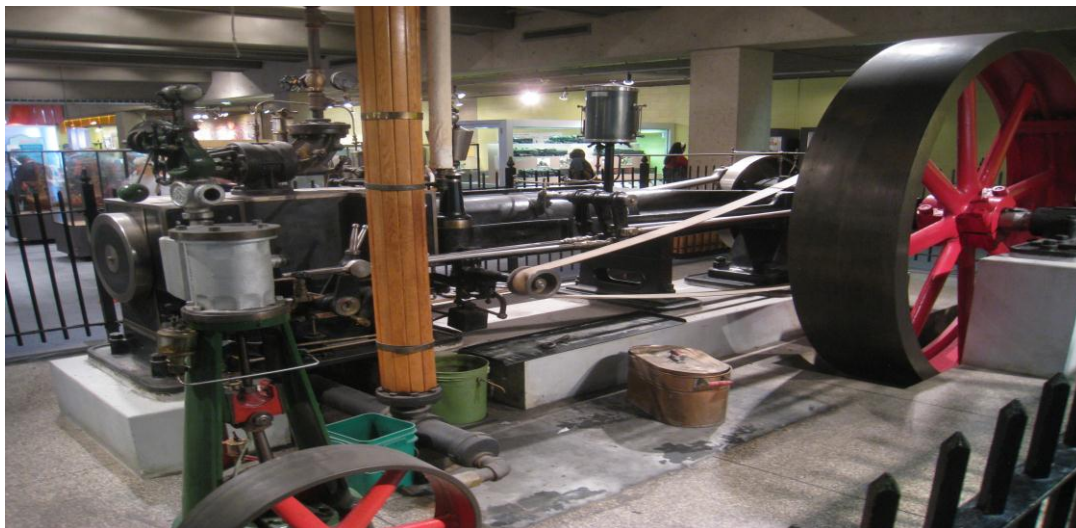
تصویر ۷) ماشین‌های اولیه (۱۳۹۳)

http://livedesignonline.com/blog/sky-skan-provides-expansive-sound-charles-hayden-planetarium-bostons-museum-science-harmans-jbl