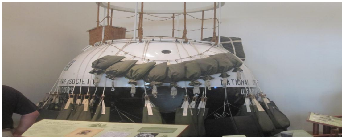
تصویر ۱۸) موزه ملی هوا فضا واشنگتن DC (۱۳۹۰)