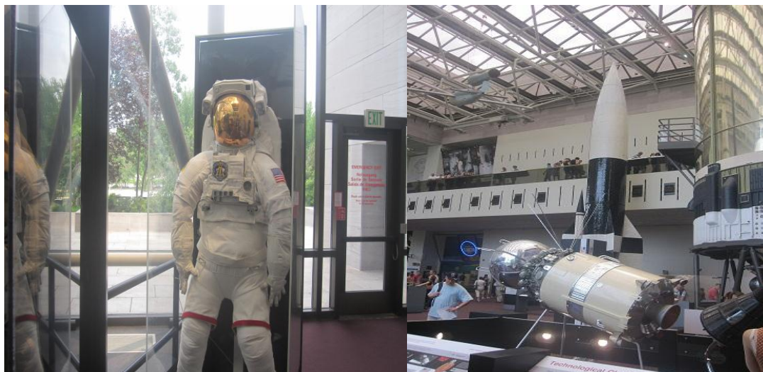
تصویر ۱۴) موزه ملی هوا فضا واشنگتن DC (۱۳۹۰)