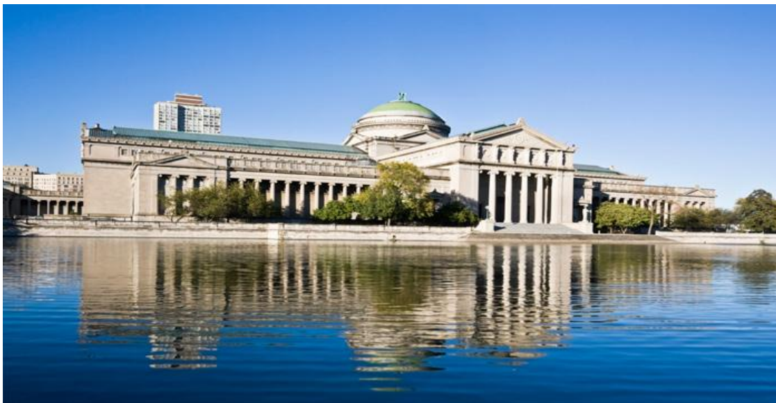
تصویر ۱۲) نمای بیرونی موزه علم و صنعت شیکاگو

( http://dn.educationaltravel.com/sites/museum-of-science-and-industry-2/ )