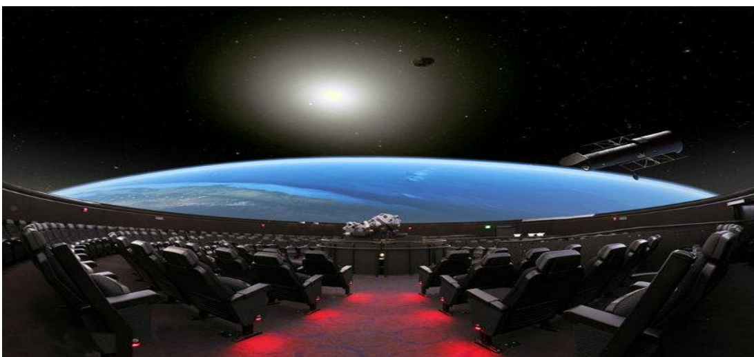
تصویر ۶) سالن آمفی تئاتر نجوم (۱۳۹۳)

http://livedesignonline.com/blog/sky-skan-provides-expansive-sound-charles-hayden-planetarium-bostons-museum-science-harmans-jbl