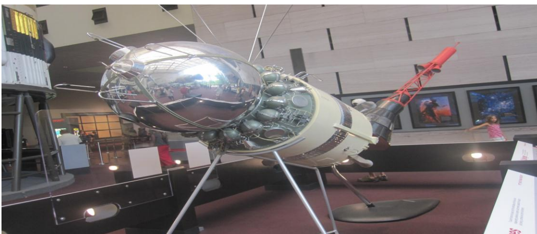
تصویر ۱۶) موزه ملی هوا فضا واشنگتن DC (۱۳۹۰)