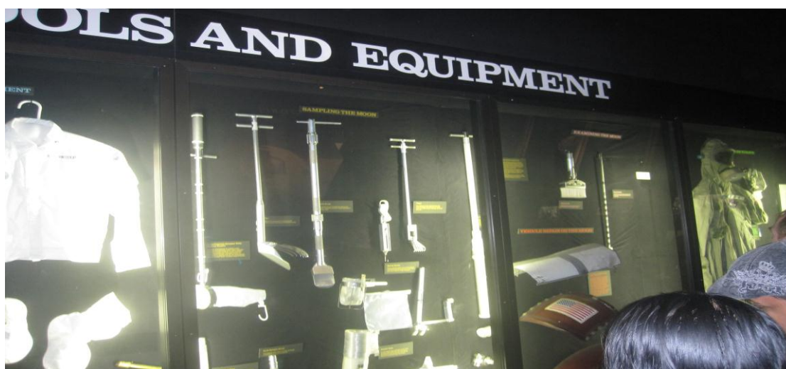
تصویر ۱۷) موزه ملی هوا فضا واشنگتن DC (۱۳۹۰)

یک مثال دیگر از موزه‌های علم و فناوری، موزه‌ی ملی هوا و فضا واقع در Washington D.C است که بزرگ‌ترین مجموعه‌ی تاریخی فضاپیماها و هواپیماها را در بر می‌گیرد. این موزه در سال ۱۹۴۶ ساخته شده است. سالانه حدود ۶/۷ میلیون نفر از این موزه بازدید می‌کنند و این موزه رتبه‌ی ۵ دنیا را در تعداد بازدیدکنندگان دارا می‌باشد. این موزه علاوه بر سالن‌های بازدید، بخش‌هایی نیز برای تحقیقات در زمینه‌ی هواپیما، فضاپیما، علوم ژئولوژی و ژوفیزیک دارد. در این موزه تمامی فضاپیماها و هواپیماها همگی اصل و یا کپی از یک دستگاه اصل می‌باشند (تصویر ۱۶-۱۴). بسیاری از دستگاه‌های موجود در این موزه اهدایی از طرف ارتش، ناسا، شرکت‌های هواپیمایی مختلف از جمله بوئینگ است. برخی از آن‌ها نیز هواپیماهایی هستند که توسط ارتش آمریکا در طی جنگ جهانی دوم از