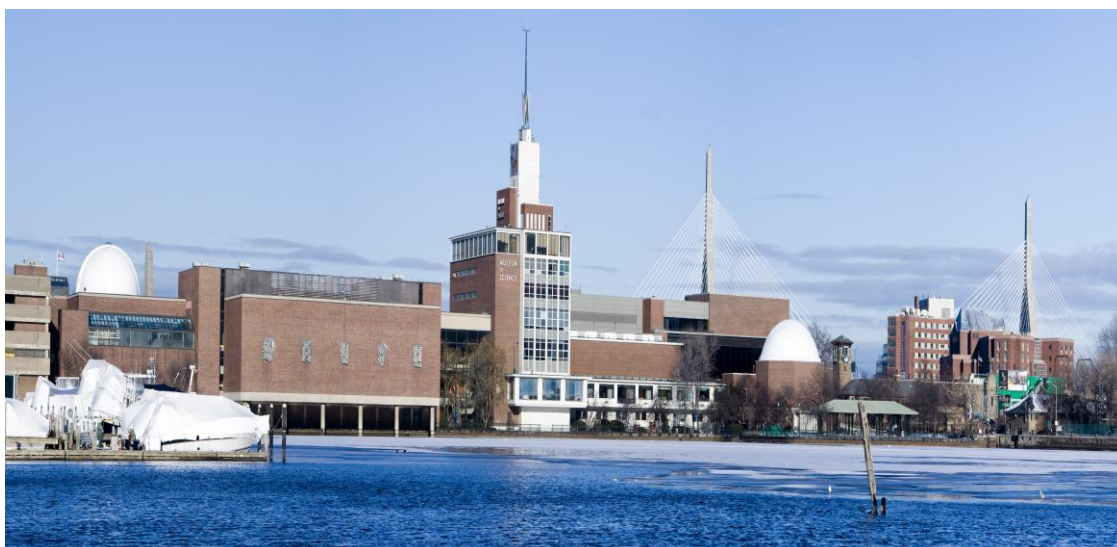
تصویر ۱) نمای کلی موزه علم بوستون

http://commons.wikimedia.org/wiki/File:MOS_Boston_on_Charles.jpg