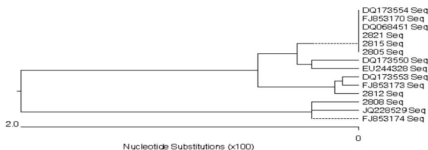
شکل ۳): دندروگرام مربوط به بررسی میزان قرابت سروارهای واکسینال استفاده شده در این تحقیق با نمونه‌های لیتوسپیرای ثبت شده در بانک ژنی بر اساس ژن lipL21 با استفاده از نرم‌افزار MEGA5

جدول ۱) درصد تشابه و اگرایی در میان سروارهای مختلف استفاده شده در تحقیق حاضر و سروارهای لیتوسپیرای ثبت شده در بانک ژنی بر اساس آنالیز توالی ژن lipL21