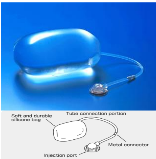
شکل ۱) مدل تیشو اکسپندر شامل: کیسه قابل اتساع، لوله رابط و یک کانکتور مرتبط کننده قابل تنظیم

تیشو اکسپندر دارای یک کیسه قابل اتساع سیلیکونی (در حجم‌های مختلف)، یک موضع تزریق خود مسدود شونده، دو لوله رابطه و یک کانکتور مرتبط کننده قابل تنظیم است و به صورت ۱۰۰ درصد از سیلیکون تهیه می‌شود. این محصول استریل شده می‌باشد و در صورت رعایت شرایط مناسب تا پنج سال قابل نگهداری است (۱ و ۳).