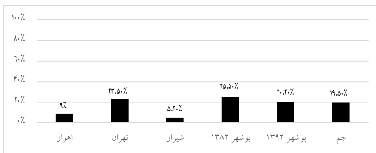
نمودار ۲) فراوانی آلرژی بینی در شهرهای ایران بر اساس برنامه ISAAC

می‌باشد (۱۴ و ۱۵). به علاوه در این مطالعه نیز شیوع علائم رینیت در بین پسرها بیشتر از دخترها بود که منطبق با نتایج سایر مطالعات می‌باشد (۱۴ و ۱۱). در این مطالعه شیوع علائم آلرژی بینی بیشتر در فصل پاییز بود که می‌تواند به دو دلیل باشد، ابتدا مواجهه با عوامل حساسیت‌زای درون منزل نظیر مایت‌ها، کپک و سوسک که با توجه به سرد شدن هوا و حضور بیشتر کودکان در