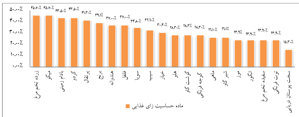
نمودار ۴) فراوانی آلرژن‌های غذایی در بیماران مبتلا به کهیر حاد بر اساس واکنش‌پذیری تست پوستی پریک

فراوانی آلرژن‌های غذایی در بیماران مبتلا به کهیر حاد میزان فراوانی کهیر حاد در بیماران ۴/۱ درصد (۴۶ نفر) بود که ۴۱/۳ درصد مرد (۱۹ نفر) و ۵۸/۶ درصد زن (۲۷ نفر) بودند و از نظر جنس اختلاف معنی دار نبود ( P>0/05 ). همچنین فراوانی واکنش‌پذیری تست پوستی