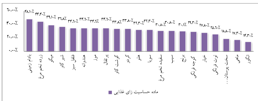
نمودار ۵) فراوانی آلرژن‌های غذایی در بیماران مبتلا به آگزما براساس واکنش‌پذیری تست پوستی پریک

فراوانی آلرژن‌های غذایی در بیماران مبتلا به آگزما (درماتیت آتوپی) میزان فراوانی بیماری آگزما در بیماران به‌طور کلی ۱۲ درصد (۱۳۳ نفر) بود که ۲۳/۳ درصد از بیماران مرد