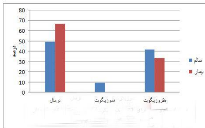
نمودار (۱) نمودار توزیع فراوانی مارکر rs904952 در گروه سنی زیر ۴۰ سال Fig 1) Distribution chart of marker rs904952 in the age group under 40 years