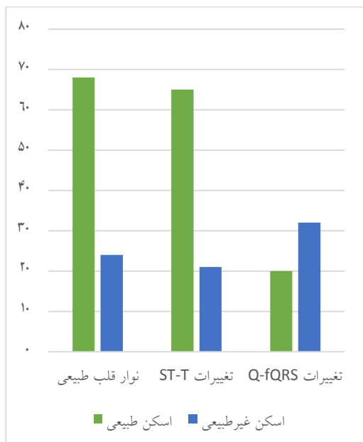
نمودار ۱) توزیع اسکن پرفیوژن میوکارد طبیعی و غیر طبیعی در سه زیر گروه نوار قلب

مقایسه زیر گروه‌های مورد بررسی با استفاده از آزمون کای دو بر اساس یافته‌های ECG بر حسب متغیرهای دموگرافیک و بالینی بیماران نشان داد که اگر چه سه زیر گروه مورد بررسی از لحاظ متغیرهای سن ( P=0/398 )، دیابت ( P=0/696 )، پرفشاری خون ( P=0/199 )، اختلالات چربی خون ( P=0/130 )، استعمال سیگار ( P=0/534 ) و سابقه فامیلی مثبت CAD ( P=0/686 ) که جزء فاکتورهای خطر ابتلا به CAD می‌باشند، تفاوت معناداری نداشتند اما از نظر شیوع سابقه CAD تفاوت معناداری مشاهده شد ( P<0/001 ).