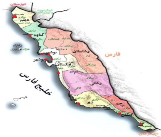
شکل ۱) موقعیت ایستگاه‌های نمونه‌برداری ماهی زمین‌کن دم‌نواری در سواحل خلیج فارس استان بوشهر (ایستگاه‌ها شامل دیلم، گناوه، بوشهر (در ۴ نقطه)، دلوار، دیر، کنگان و عسلویه می‌باشد).

است این گونه از ماهی‌ها جهت استتار و زیست خود نیاز به رفتن به زیر ماسه‌های کف دریا را دارند و از همان‌جا نیز تغذیه می‌کنند. لذا در صورت آلودگی دریا به استرانسیوم ۹۰ و نشست این رادیونوکلیئید در کف دریا، با احتمال جذب این رادیونوکلیئید در ساختار استخوانی این گونه از ماهی‌ها، آن‌ها نمونه‌های مناسبی هستند که می‌توانند آلودگی را نمایان کنند. بدین منظور در ۱۰ نقطه از سواحل خلیج فارس حاشیه استان بوشهر نمونه‌برداری انجام پذیرفت. مکان‌های نمونه‌برداری به گونه‌ای انتخاب شدند که به‌طور تقریبی تمام سواحل استان بوشهر با خلیج فارس را پوشش داد. این نقاط شامل دیلم، گناوه، بوشهر (در ۴ نقطه)، دلوار، دیر، کنگان و عسلویه بود. در شکل ۱ موقعیت ایستگاه‌های نمونه‌برداری ماهی زمین‌کن دم‌نواری در سواحل خلیج فارس استان بوشهر به صورت مشخص (نقاط قرمز رنگ) آورده شده است (۱۶). قابل ذکر است نقاط نمونه‌برداری به گونه‌ای انتخاب شدند که محدوده ۷۰۰ کیلومتری مرز دریایی استان بوشهر با خلیج فارس را پوشش داد.