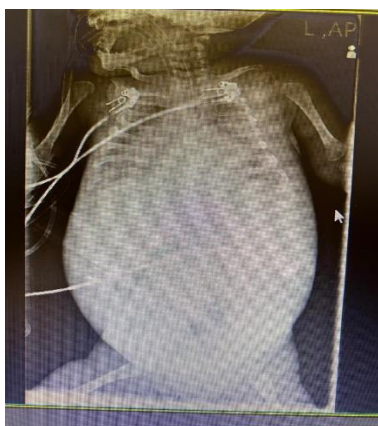
شکل ۱) گرافی بیمار با شواهد وجود کبد و طحال بزرگ

شواهدی دال بر وجود سلول‌های اسفنجی (کف آلود) وجود داشته باشد، می‌تواند نشانه‌ای بارزی از بیماری نیمین پیک باشد (۸). در این مقاله یک مورد بیمار جالب مبتلا معرفی می‌گردد. امروزه سرعت انجام اتوپسی به‌طور واضح کاهش یافته است که علت آن تکنولوژی‌های جدید تشخیص و عدم علاقه پزشکان در تعیین تشخیص بعد از مرگ است. گرچه آینده اتوپسی در مطالعات ژنتیکی و مولکولار امیدوارکننده است. اتوپسی در مرگ‌های کودکان به این نتیجه رسیدند که اتوپسی یک ابزار بالینی مهم فراهم آورنده اطلاعات کاربردی برای یافتن علل مرگ در نوزادان، شیرخواران و کودکان می‌باشد (۹).