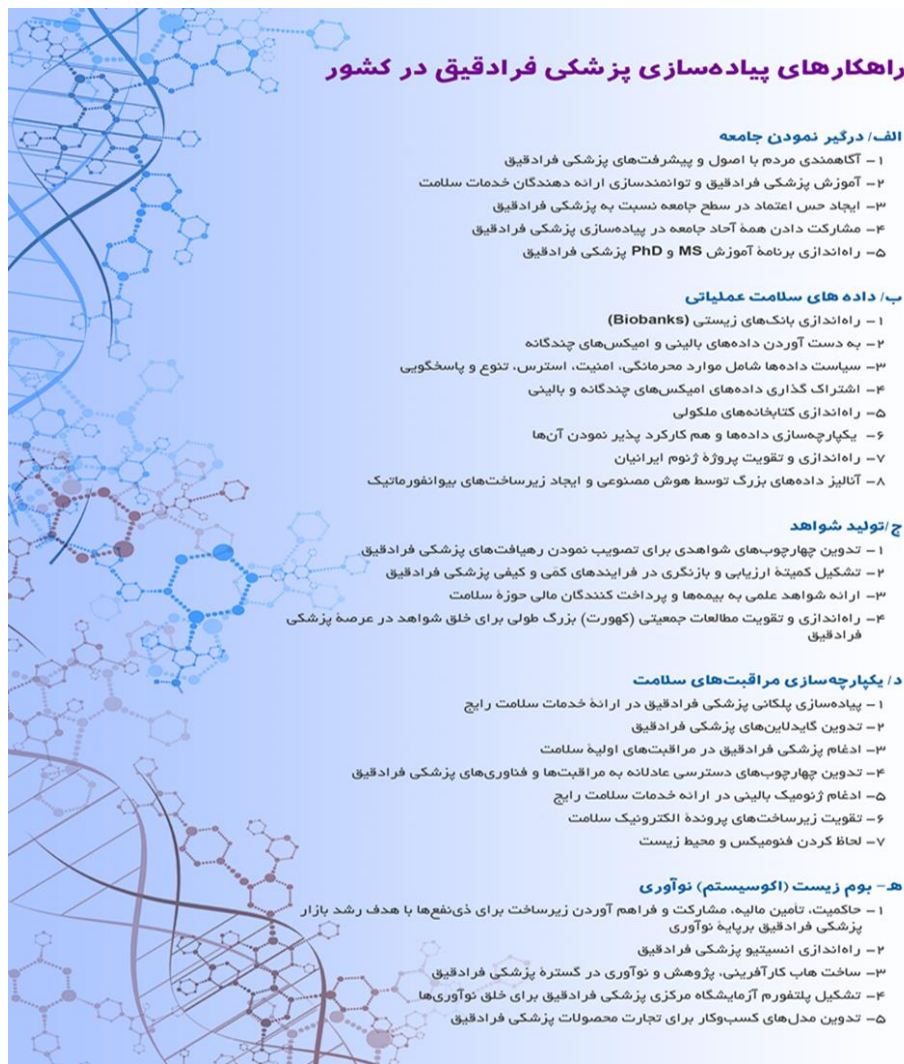
تصویر ۸) راهکارهای پیاده‌سازی پزشکی فرادقیق در کشور

راهبرد سوم: سلامت دیجیتال و هوش مصنوعی در برنامه توسعه پایدار ۲۰۳۰ سازمان بهداشت جهانی برای یکپارچه‌سازی جهان، گسترش فناوری اطلاعات و ارتباطات به‌عنوان عامل کلیدی و ابزاری پر قدرت برای تسریع پیشرفت انسان در حوزه دیجیتال و حذف شکاف بین کشورها در توسعه جامعه دانش بنیان مطرح شده است. در واقع با تکیه بر قابلیت‌ها و توانایی فناوری‌های دیجیتال، یک میلیارد نفر از مردم بیشتر از پوشش همگانی سلامت بهره‌مند خواهند