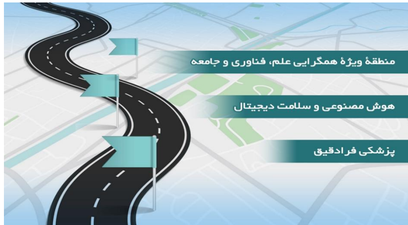
تصویر ۶) راهبردهای پیاده‌سازی سناریوی مطلوب در گستره پزشکی آینده کشور

نظام‌های سلامت و شکل‌دهی به پیش‌ران‌های پزشکی فرادقیق می‌باشند (تصویر ۶).