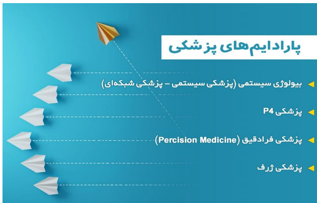
تصویر ۲) پارادایم‌های مطرح در گستره پزشکی

ابروندها بر روی آینده پزشکی کشور مورد تجسم قرار گیرد. این ابر روندها که عناصر ساختاری STEEP (اجتماعی=S، فناوری=T، زیست محیطی=E، سیاسی=P) را شکل می‌دهند، در تصویر ۳ نشان داده شده‌اند.