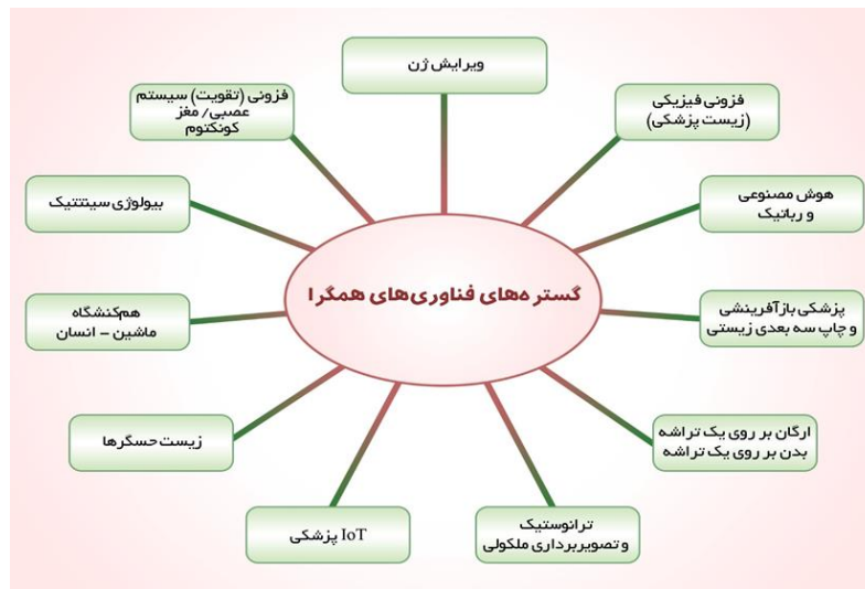
تصویر ۵) نقشه راه فناوری برای پزشکی آینده ایران (گستره‌های فناوری‌های همگرا و رهیافت‌هایی که پتانسیل زایش فناوری‌های همگرا را دارند).

پیش از ورود به بحث ترسیم نقشه راه فناوری جهت تدوین نقشه راه فناوری‌های همگرا، یادآوری این نکته مهم ضروری است که هنوز تفاهمی در سطح ادبیات سیاست علمی جهان پیرامون این که چه گستره‌هایی از فناوری و پژوهش و تحقیق در زیر چتر همگرایی قرار می‌گیرند، وجود ندارد و هنوز چندان آشکار نیست که کدامیک از این فناوری‌ها را می‌توان برای همگرایی بحرانی نامید. این خود برخاسته از این موضوع است که هنوز در تعریف واژه فناوری‌های همگرا، یک اجماع در سطح جامعه