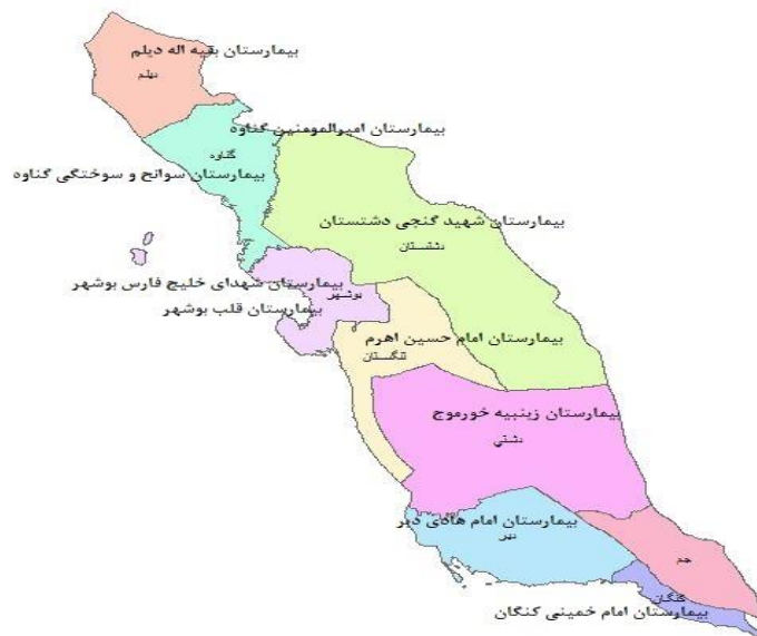
شکل ۱) موقعیت جغرافیایی بیمارستان‌های وابسته به دانشگاه علوم پزشکی بوشهر در سال ۱۴۰۰ Fig 1) Geographical location of hospitals affiliated to Bushehr University of Medical Sciences in 1400

مربوط به کای حرفه‌ای با ۳۲ درصد، دارو و تجهیزات مصرفی با ۲۴ درصد و هتلینگ با ۲۰ درصد بوده است.