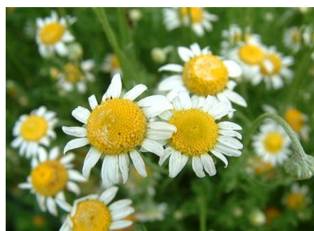
شکل (۲) بابونه جنس آتمیس ( Anthemis Sp. ) در استان بوشهر

معمولاً نهنج و گل آن‌ها پهن (پخ) می‌باشد (شکل ۲). در غیر این صورت با اسانس‌گیری و تجزیه مواد مؤثره‌ی موجود در آن‌ها قابل شناسایی هستند به گونه‌ای که بابونه‌ی دارویی (معروف به بابونه شیرازی در ایران) دارای اسانس به رنگ آبی تیره و حاوی ماده‌ی مؤثره‌ی کامازولن می‌باشد؛ در حالی که سایر گونه‌ها این