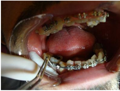
شکل ۱: فرآیند نمونه‌گیری از پلاک‌های زیرلثه‌ای

اسلامی واحد کرج منتقل گردیدند و تا بررسی‌های مولکولی در فریزر 20^{\circ}\text{C} - نگهداری شدند.