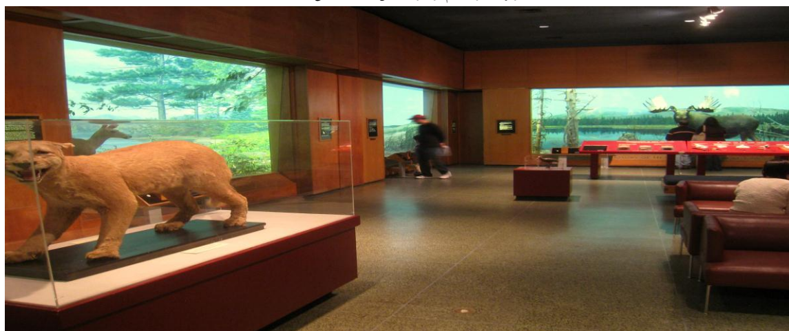
تصویر ۹) موزه علم بوستون (سالن طبیعت‌شناسی) (۱۳۹۳)