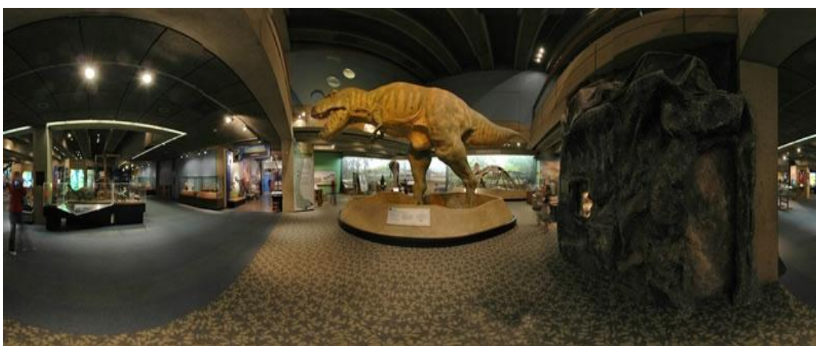
تصویر ۸) موزه علم بوستون (سالن طبیعت‌شناسی) (۱۳۹۳)

هر کدام از موزه‌های علم در سراسر دنیا، بخش‌ها و یا برنامه‌های منحصر به فرد مخصوص به خود را دارند. یکی از این برنامه‌های جالب، برنامه‌ی سپری کردن شب در موزه برای دانش‌آموزان است که آن‌ها می‌توانند یک شبانه روز در موزه بمانند و با قسمت‌های مختلف آن به خوبی آشنا شوند. یا مثلاً موزه‌ی شیکاگو به علت برگزاری گالری‌های بسیار زیادی که به صورت موقت ارائه می‌کند شهرت دارد (۱۳).