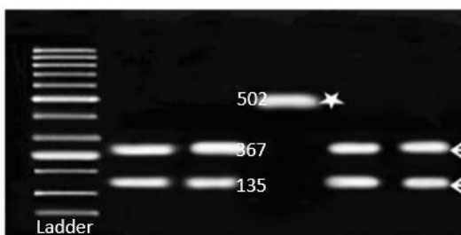
شکل ۳) آنزیم MboII در مورد سویه‌های موتانت باندهای ۳۶۷bp و ۱۳۵ bp (مکان‌های نشان داده شده توسط فلش) و برای سویه‌های غیر موتانت باند ۵۰۲bp (جایگاهی که توسط ستاره مشخص شده است) را نشان می‌دهد.

همان‌گونه که با نرم‌افزار Genetyx پیش‌بینی شده بود، برش محصول ۵۰۲ جفت بازی با آنزیم BsajI برای سویه‌های موتانت باندهای ۹۴bp، ۶۴bp، ۱۶۶bp و ۱۷۸ bp و برای سویه‌های غیر موتانت باندهای ۹۴bp، ۲۳۰ bp و ۱۷۸ bp را ایجاد نمود از ۲۵ سویه میکوباکتریوم تورکلوزیس که برای بررسی موتاسیون در ژن rpsL انتخاب شدند، ۱۴ سویه از نظر فنوتیپی مقاوم و ۱۱ سویه حساس بودند. آنزیم BsajI قادر به تشخیص ۹ سویه موتانت از میان ۱۴ سویه مقاوم فنوتیپی (۶۴ درصد سویه‌های مقاوم) بود. آنزیم MboII نیز از میان ۱۱ سویه حساس، ۱۰ سویه را فاقد موتاسیون تشخیص داد (شکل ۳). حساسیت این روش ۹۰ درصد و ویژگی آن ۶۸ درصد بوده است.