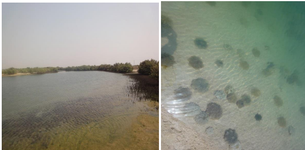
شکل ۱) دو تصویر از منطقه مورد مطالعه در خلیج نایبند، نزدیک عسلویه در شمال (۳۵°E ۳۰°S، ۲۷°)

تمام مواد، حلال‌های شیمیایی و استانداردهای مورد استفاده به ترتیب از شرکت مرک و سیگمای آلمان تهیه گردیدند.