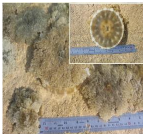
شکل ۲) نمونه زنده عروس دریایی C. andromeda در خلیج نابیند، بوشهر - ایران.