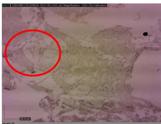
شکل ۳) مقطع بافت پا و غده پلی فنلی صدف Modiolus sp. PG رنگ آمیزی شده به روش هماتوکسیلین - ائوزین

جهت تشخیص غدد پلی فنلی بافتی پس از مراحل تثبیت