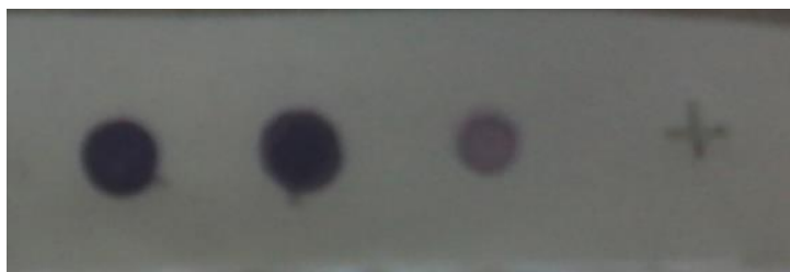
شکل ۵) دات بلات پروتئین‌های پلی‌فنلی رنگ‌آمیزی شده توسط NBT

M. edulis معادل ۴۵ کیلو دالتون قبلاً گزارش شده بود (۳۲) لذا با توجه به وزن مولکولی گزارش شده و موقعیت پروتئین fp-2 در سایر جنس‌ها در اینجا باند مشخص شده حاوی پروتئین fp-2 بود.