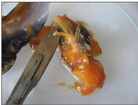
شکل ۱) تشریح و جداسازی اندام پای صدف

شد. نمونه‌ها در تانک ازت به آزمایشگاه تحقیقاتی بیوتکنولوژی دانشگاه علوم پزشکی بوشهر منتقل گردید و تا زمان تشریح، نمونه‌ها در فریزر ۸۰- نگهداری شد. از روش شناسایی مورفولوژیکی و ژنتیکی جهت مشخص نمودن جنس و گونه مورد مطالعه استفاده گردید سپس جهت مشاهده غده پلی‌فنیلی از بافت پای صدف مقاطع بافتی تهیه شد و جهت رنگ‌آمیزی از رنگ‌های هماتوکسیلین-ائوزین استفاده شد. به منظور استخراج پروتئین پس از تشریح (شکل ۱) اندام پا جدا و بلافاصله در بافر استخراج کننده سرد (استیک اسید ۵ درصد) قرار گرفت. تمامی مراحل در دمای ۴ درجه سانتی‌گراد و بر روی یخ انجام شد.