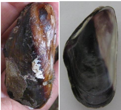
شکل ۲) صدف دریایی بیسال‌دار ( Modiolus sp. PG )

عمدتاً طبقه‌بندی تاکسونومیکی صدف‌های مایتیلید بر اساس ویژگی‌های ظاهری پوسته صدف در نمونه بالغ صورت می‌گیرد (۳۱). لذا جهت گونه‌شناسی صدف، خصوصیات ریخت‌شناسی مربوطه از جمله رنگ، اندازه، شکل صدف و غیره ثبت شده و سپس مشخصات مذکور با کلیدهای شناسایی FAO و کتاب نرم‌تان سواحل خلیج فارس ایران از تجلی‌پور تطبیق داده شد که نمونه مورد مطالعه جزو خانواده Mytilidae و از جنس Modiolus بود (شکل ۲).