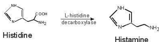
شکل ۱) دکربوکسیلاسیون هیستیدین توسط آنزیم هیستیدین دکربوکسیلاز و تولید هیستامین

هیستامین یا ۲-۴ آمینو اتیل ایمیدازول ۲ یا بتا آمینو اتیل ایمیدازول یک مولکول هیدروفیل ۳ بوده و از یک حلقه ایمیدازول و یک گروه آمین که توسط دو گروه متیلن به یکدیگر متصل شده‌اند تشکیل گردیده است و از مهم‌ترین آمین‌های بیوژنیک است. این ترکیب، به عنوان عامل ضد تغذیه‌ای طبیعی مطرح بوده و سبب بروز مسمومیت ناشی از مصرف غذا در انسان می‌شود. هیستامین از طریق واکنش آنزیمی، دکربوکسیلاسیون توسط آنزیم هیستیدین دکربوکسیلاز ( Histidine Decarboxylase ) بر روی اسید آمینه هیستیدین موجود در ماهی تولید می‌گردد (شکل ۱) (۱۰).