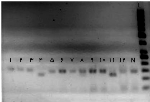
شکل (۲) الکتروفورز محصول حاصل از هضم آنزیمی بر روی ژل آگاروز ۲ درصد نمونه‌های شماره ۴ و ۱۱ هموزیگوت‌های A/A و سایر باندها هموزیگوت‌های G/G می‌باشند. L نشانگر استاندارد وزن مولکولی DNA است. باند پایین ژل پرایمردایمر می‌باشد.

فراوانی هموزیگوسیتی برای آلل A (ژنوتیپ A/A) در بین افراد دیابتی و غیردیابتی به ترتیب برابر با صفر و ۳ نفر، فراوانی هموزیگوسیتی برای آلل G (ژنوتیپ G/G) در بین بیماران و افراد سالم نیز به ترتیب برابر با ۷ و ۱۱ نفر بود. در این مطالعه مشاهده شد که فراوانی هتروزیگوسیتی (ژنوتیپ A/G) در بین افراد دیابتی و غیردیابتی به ترتیب برابر با ۹۵ و ۸۶ نفر است. فراوانی آلل A در گروه بیماران ۷ و در گروه کنترل ۱۷ بود. فراوانی آلل G در گروه بیماران ۱۹۷ و در گروه کنترل ۱۸۳ بود. در این مطالعه براساس مطالعات هوریکایا و (۳۹) و گارانت (۳۱) که در دو جمعیت آمریکایی‌های مکزیک‌تبار و آمریکایی‌های آفریقایی‌تبار انجام شد، داشتن آلل G را عامل خطر (Risk factor) محسوب کرده‌ایم و در این مطالعه مشاهده گردید که بین توزیع آلل‌های A و G در گروه بیماران و کنترل تفاوت معنادار آماری مشاهده شد ( P=0/037 ; 6/45 و 1/06 ) (۹۵ درصد CI و OR=2/61 ).