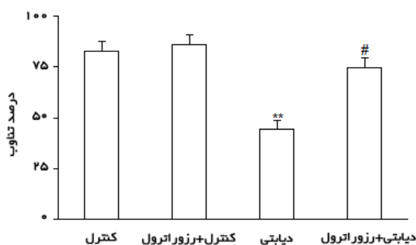
نمودار ۲) میزان درصد تناوب در آزمون ماز Y در موش‌های صحرائی کنترل و دیابتی تیمار شده با رزوراترول به‌صورت خوراکی پس از گذشت ۸ هفته ** P < 0/01 (در مقایسه با گروه کنترل)، # P < 0/05 (در مقایسه با گروه دیابتی)

نتایج تست ماز Y که شاخصی از حافظه فضائی در جوندگانی نظیر موش صحرائی می‌باشد نشان داد که در صد تناوب در حیوانات دیابتی به‌طور معنی‌دار کمتر از گروه کنترل بوده است ( P < 0/01 ). درصد تناوب در گروه دیابتی تحت تیمار با رزوراترول افزایش معنی‌دار نسبت به گروه دیابتی نشان داد ( P < 0/05 ) و تجویز رزوراترول به گروه کنترل نیز تغییر معنی‌دار در مقایسه با گروه کنترل ایجاد نمود (نمودار ۲).