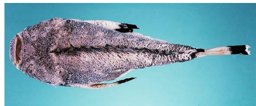
تصویر ۱) سنگ ماهی Pseudosynanceia melanostigma موسوم به فریاله، در سواحل بوشهر

گونه‌ی شایع سنگ ماهی در سواحل خلیج فارس Pseudosynanceia melanostigma است که در نزد بومیان منطقه ایرانی خلیج فارس به فریاله ماهی موسوم است. این ماهی در سواحل گلی استان بوشهر و حوالی خور موسی به فراوانی دیده می‌شود و زهرآفرینی آن، برای تمامی سواحل‌نشینان بومی شناخته شده است. تصویر ۱ مربوط به سنگ ماهی Pseudosynanceia melanostigma موسوم به فریاله می‌باشد که در سواحل بوشهر گرفته شده است.