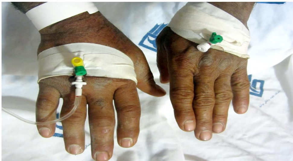
تصویر ۲) متعلق به یک بیمار آسیب دیده با سنگ ماهی در ناحیه‌ی دست.

وجود لنفانژیت، آرتریت، عفونت ثانویه و آبسه نیز بررسی می‌شد. در پرسشنامه‌ی پژوهش جزئیات مراقبت‌های اولیه و مدیریت بالینی بیمار، شامل فرو بردن اندام آسیب دیده در آب ولرم، برداشت خار و جسم خارجی از سطح زخم، تزریق مایعات وریدی، داروهای آنالژژیک و یا بی‌حس کننده، تجویز توکسوئید ضد تانوس، تجویز آنتی‌بیوتیک، چه به صورت موضعی، وریدی و یا عضلانی، ثبت می‌گردید. چنانچه فرد آسیب دیده، در بیمارستان بستری می‌گردید، سیر بیماری وی نیز مورد پیگیری قرار می‌گرفت.