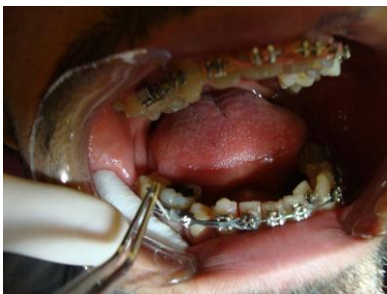
شکل ۱: فرآیند نمونه‌گیری از پلاک‌های زیرلثه‌ای

اسلامی واحد کرج منتقل گردیدند و تا بررسی‌های مولکولی در فریزر 20^{\circ}\text{C} - نگهداری شدند.