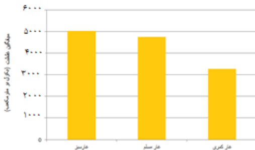
نمودار ۲) میانگین غلظت گاز رادون در سه غار (Bq/m 3 )