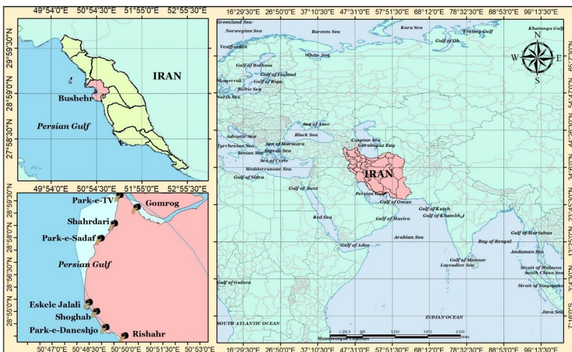
شکل ۱) ایستگاه‌های ورود فاضلاب خام به آب دریا در نوار ساحلی شهر بوشهر

در فواصل نوامبر ۲۰۱۷ تا اکتبر ۲۰۱۸، در مجموع ۴۸ نمونه فاضلاب خام شهری از ۸ ایستگاه تخلیه (پارک تی وی، ریشهر، شغاب، پارک دانشجو، پارک صدف، اسکله جلالی، گمرگ و شهرداری) در خط ساحلی شهر بوشهر جمع‌آوری شد (شکل ۱). در هر ایستگاه سه نمونه (هر نمونه ۲۰ لیتر) برای هر یک از فصول زمستان و تابستان جمع‌آوری شد. نمونه‌های فاضلاب از طریق