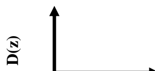
فاصله در راستای محور Z بر حسب \text{cm}