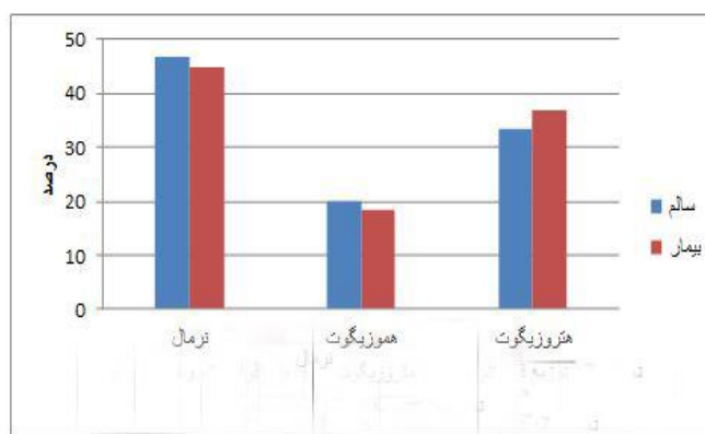
نمودار (۲) نمودار توزیع فراوانی مارکر rs904952 در گروه سنی بالای ۴۰ سال Fig 1) Distribution chart of rs904952 marker in the age group over 40 years